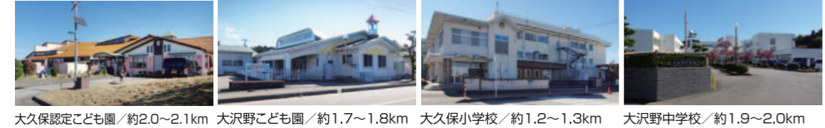
大久保認定こども園/約2.0~2.1km 大沢野こども園/約1.7~1.8km 大久保小学校/約1.2~1.3km 大沢野中学校/約1.9~2.0km