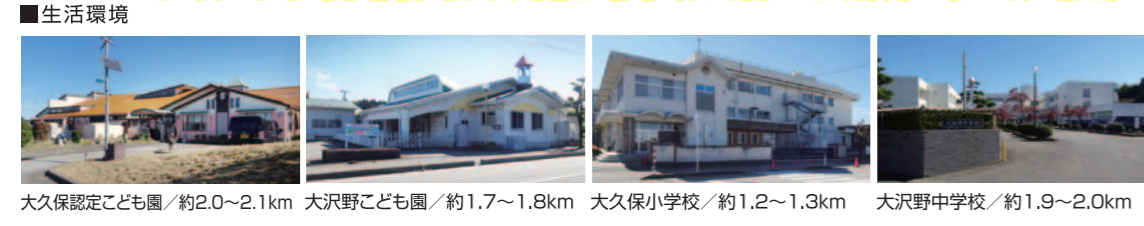
大久保認定こども園/約2.0~2.1km 大沢野こども園/約1.7~1.8km 大久保小学校/約1.2~1.3km 大沢野中学校/約1.9~2.0km

■生活環境 ●高山本線 東八尾駅...約3.7~3.8km ●セブンイレブン...約1.0~1.1km ●高山本線 笹津駅...約4.2~4.3km ●クスリのアオキ...約860m~1.0km ●上大久保バス停...約370~510m ●大沢野中央診療所...約500~640m ●パロ...約600~740m ●大沢野クリニック...約880m~1.0km ●グリーンパレー...約640~780m ●コメリH&G...約1.5~1.6km ●キョーエイキャロット...約1.4~1.5km ●大沢野郵便局...約1.2~1.3km ●ファミリーマート...約820~960m ■団地概要/自主協定 団地概要 ●物件所在地/富山市上大久保字牛ヶ花割1713番地4筆・富山市中大久保字東入割54番地3筆及び市有地 ●販売総面積/9,127.50m 2 (2,761.06坪) ●総区画数/34区画 ●今回販売区画/34区画 ●地目/宅地 ●都市計画/用途地域/市街化第一種住居地域 ●建ぺい率・容積率/60%・200% ●道路/団地内道路市道6.0~6.7m全面アスファルト舗装 ●上・下水道/富山市営 ●ガス/個別プロパン ●電気/北陸電力等、その他小売電気事業者 ●CATV/全区画引込み ●消雪装置/団地内設置 ●ゴミステーション/団地内に1カ所 ●調整池/団地内に2カ所 ●井戸/団地内に1カ所 ●開発許可番号/富山市指令建指第789号(R05開発023)令和5年11月21日 ●取引態様/売主:富山県知事(7)第2271号 ●広告有効期限/令和6年6月末日 ●掲載内容と現況が異なる場合は、現況を優先いたします。 自主協定 ●高基礎住宅は建築できません(基礎高GL+700mmまで) ●戸建住宅・一戸建貸家またはそれに類する建物とし、アパート・マンション等の集合住宅は建築できません ●屋上庭園付建築物及び3階建以上の建築物は建築できません ●電柱及び支線、ゴミステーション、井戸、交通標識等の移動撤去等はできません ●上記項目は後日第三者へ譲渡する際も適用されます