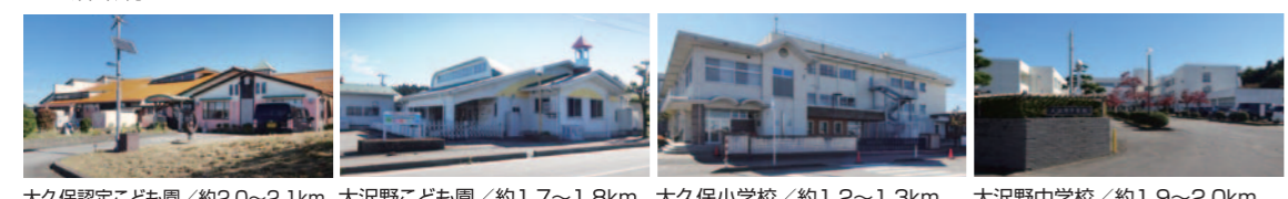
大久保認定こども園/約2.0~2.1km 大沢野こども園/約1.7~1.8km 大久保小学校/約1.2~1.3km 大沢野中学校/約1.9~2.0km