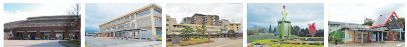
出町小学校 出町中学校 市立砺波総合病院 砺波チューリップ公園 砺波市役所