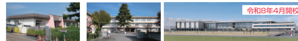
水橋西部保育所/約960m~1,040m 水橋西部小学校/約1,000m~1,080m 義務教育学校水橋学園/約750m~830m