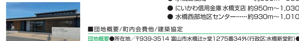
水橋児童館/西隣~約80m SCミュージズ(アルビス)/約2,000m~2,080m

■団地概要/町内会費他/建築協定 団地概要●所在地/〒939-3514 富山市水橋辻ヶ堂1275番34外(行政区:水橋新堂町)● 区画数/15区画(販売数も同数)●開発総面積/4,098.50㎡(1239.79坪)●交通/あいの 風とやま鉄道水橋駅まで約200m~275m(徒歩約3~4分)●地目/宅地●都市計画/都 市計画区域内/市街化区域●用途地域/第1種住居地域●建ぺい率/60%●容積率/200% ●道路/南側既存道路、団地内道路:富山道6.0m●上下水道/富山市営●ガス/個別プロ パン●電気/北陸電力等、その他小売電気事業者●ゴミステーション/団地内1ヶ所●融雪装 置/団地内設置●開発行為許可番号/富山市指令建指第110号(R05開発002)令和5年6 月6日●取引態様/売主:株式会社ビルト 富山県知事(7)2271号●その他/富山市公共交 通沿線住宅取得支援事業●広告有効期限/2024年12月末日 町内会費他●町内会費12,000円/年●公民館修繕積立金/20,000円/世帯(一度のみ)