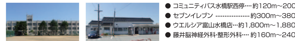
水橋中学校/約1,300m~1,380m あいの風とやま鉄道水橋駅/約200m~280m